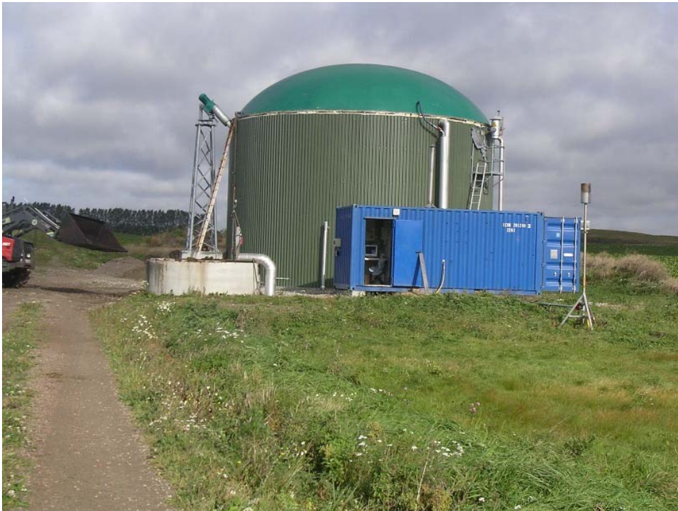
Figur 1 Biogasanläggningen i Hagavik

Fakta/unikt: Ekologisk växtodling med biogödsel som näringskälla Lönsam försäljning av el